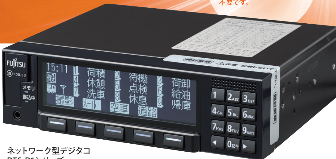
ネットワーク型デジタコ DTS-D1シリーズ