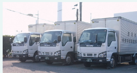
給食配送用の天然ガス(CNG)自動車