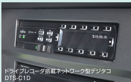
ドライブレコーダ搭載ネットワーク型デジタコ DTS-C1D

自動車部品をはじめとする各種の商工業貨物、ガソリン、給食、そして廃棄物まで、さまざまな輸配送業務を行っている京葉ロジコ様。所有している車両も、ウィング車、ローリー車、パッカー車、さらに給食配送用の天然ガス(CNG)車など、多彩です。搬入、在庫管理、配送を行う倉庫業にも事業を拡大され、ますます荷主様のご要望にお応えしています。