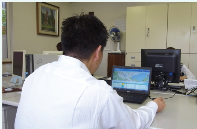
ドライブレコーダーで撮影したヒヤリ・ハット映像を再生して安全指導を行うことも