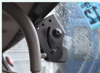
ルームミラー部に装着された広角カメラ