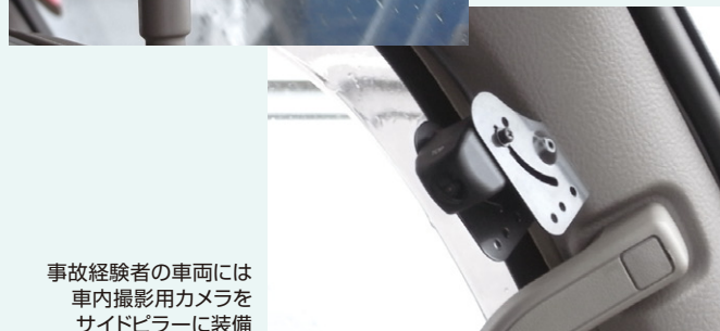
事故経験者の車両には車内撮影用カメラをサイドピラーに装備