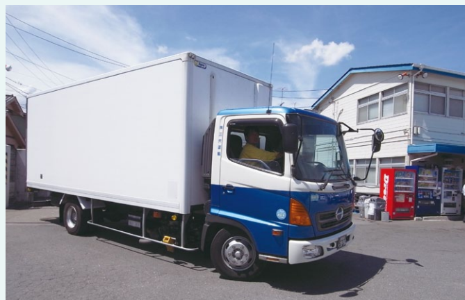
▲ボディには社名表示はない。これは、お客様に受託業者として出過ぎない姿勢が。

メモリーカードや専用PCが不要。請求書作成、給与計算、労務管理などへ、運行データが展開しやすい点もご評価いただきました。