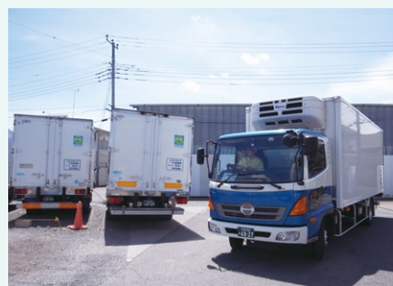
▲配送を終えたトラックが続々と帰ってくる