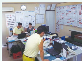
▲元気な声が飛び交う事務所