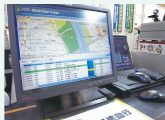
▲点呼場所にある運行支援システム

デジタコのデータを見て、気になるドライバーには、添乗して運行を行いながら、細かく指導しています。添乗指導は、お互いを知る機会にもなり、仕事以外の相談もされたりします(笑)。