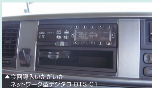
▲今回導入いただいた ネットワーク型デジタコ DTS-C1