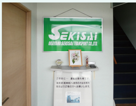
社屋入り口では花とお疲れさまメッセージがお出迎え