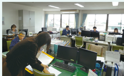
労務管理、運行管理を支えるスタッフのみなさん。