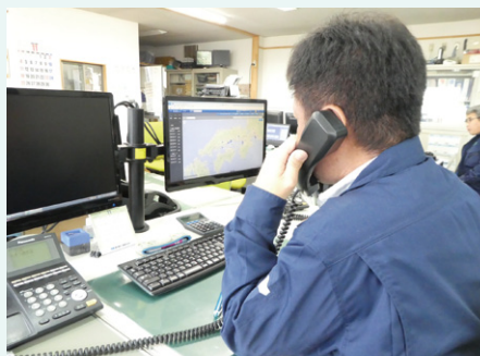
「ドライバーにはなるべく電話を使わせたくない。動態把握ならいつでも現在地が分かります」