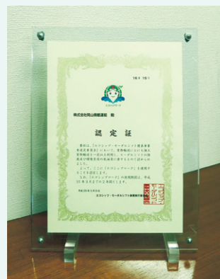
「陸上輸送」から「海陸一貫輸送」へ。CO2削減輸送を通じて環境対策に貢献する企業を応援する証、エコシップマークをいち早く取得。