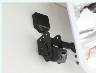
夜間でもドライバーを写す 赤外線カメラ

ヒヤリハットの映像はクラウドに保存しておいて、一泊二日の研修や新人教育に活用されています。また、新人教育には日報による違反運転の指導、ドラレコ映像を使った運転姿勢のチェックなども実施。「業界課題である人材不足は簡単に解消されません。これからはドライバーの確実な育成がさらに必要となって来ます。映像を生きた教材として活用していきたいですね。また、万一事故に遭っても、ドラレコ映像が証拠となって原因究明できるので安心です」。こんな安全への取り組みが注目され、同業他社の方が視察に訪れています。