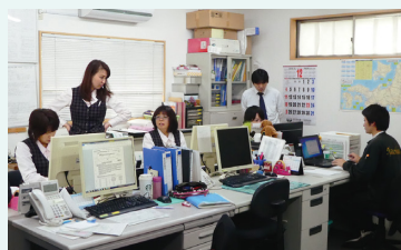
安全・正確な運行を つねに見守る スタッフの皆さん