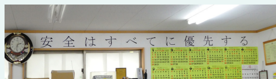
事務所内の各所に安全標語を掲出

最大5台のカメラ同時撮影に対応、撮影映像を運行中でも確認可能など、ドラレコ機能が充実したDTS-D1Dを全車に。2013年に導入したDTS-C1Dの切り換えを予定されています。さらに、AEDの装備や体温・血圧計と連動したアルコールチェッカの活用なども計画中。「安全はすべてに優先する、その姿勢に変わりありません」。