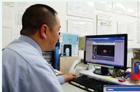
車両の現在地から運行軌跡、車内の乗員・乗客のようす、さらには天候や路面状況まで確認されている浦川部長様

人の命を運ぶ観光バス、路線バス。なの花交通バス様では、ドライバーに安全運転を徹底させるだけでなく、ドライバー自身も安心して運行できるようにドラレコ搭載ネットワーク型デジタコを採用されました。リアルタイムに位置情報を把握できるほか、複数台のカメラで捉えた映像も必要な時にすぐに確認可能です。スタッフの皆さまが運行をつねに見守っています。