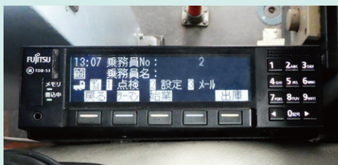
シフトレバー横に装着された ドラレコ搭載ネットワーク型デジタコ DTS-D1D

貸切バスで各種観光ツアーや冠婚葬祭、部活動遠征の送迎などを行っている、なの花交通バス様。大型車から中型車、マイクロバス、さらに車いす利用の方や高齢者にもやさしいリフト付きバスまで、54台の車両を保有されています。2015年11月からは、京成線佐倉駅～北総線・印旛日本医大駅～JR小林駅間の路線バスも運行しています。