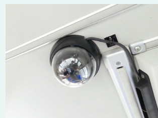
乗客のようすも確認可能 ドームカメラ