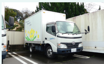
予期せぬ車両トラブルでも 応急措置対応が可能なように サポートカーを導入