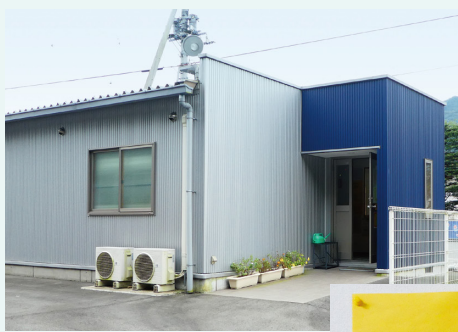
駐車場内に建てられた 休憩室兼点呼室

アサガミ様では、ヒヤリハットの映像をクラウドに保存して、全スタッフで共有化するなど、毎月の安全会議や日々の視覚教育への活用をお考えです。「百聞は一見に如かず。生きた映像教材は、いろんな危険を予測しながら運転する防衛運転につながります。社内の全営業所で共有するだけでなく、協力会社にもUSBメモリなどで配布して、安全意識の向上を図っていきたいですね」。