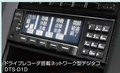
ドライブレコーダ搭載ネットワーク型デジタコ DTS-D1D

重機、化学液体、鋼材などの運輸事業、倉庫事業、港湾事業を核に、航空貨物や3PLまで多様なサービスを提供されている、アサガミ株式会社様。今回の取材先、埼玉営業所様では、自社6台、協力会社を含めると1日70~80台、多い日には100台以上のトレーラ、トラックで、関東甲信越を中心に東北、北陸から中京圏、近畿圏まで鋼材を輸送しています。