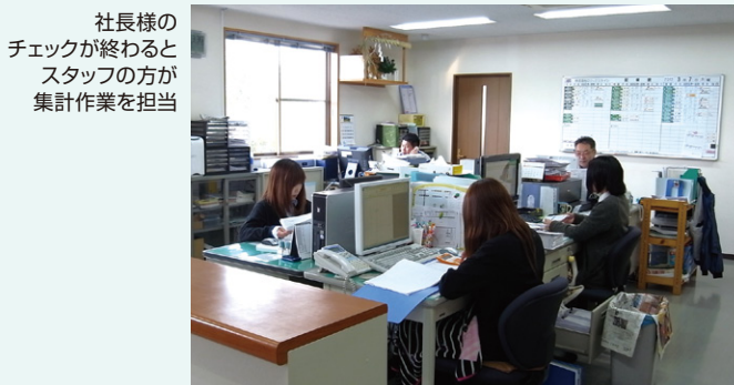
社長様の チェックが終わると スタッフの方が 集計作業を担当

日報作成が簡単! と、ドライバーの方にも好評のDTS-C1 違反運転になる前に音声警告する機能も満足のポイントに