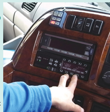
操作性も好評な ネットワーク型デジタコ DTS-C1

関東を中心に全国エリアで航空貨物の配送を行っている、ロジックスライン様。ヨーロッパの高級ブランド品から最新の情報端末、雑貨まで、扱う貨物は多彩です。毎日のスポット配車のオーダーに対応できるように、現在、大型、4t車、2t車各10台、合計30台の車両を保有されています。