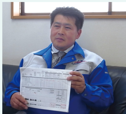
朝の日課、日報チェック 社長様自ら、労働時間管理 安全運転指導を実施